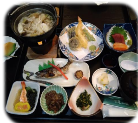
大人用お料理の一例(一部内容が変更になる場合がございます。)

※チェックインは、夕方16時からとなります。夕食は19時30分までにお済ませ下さい。ドライバーの方は、飲酒をしないようご注意ください。20時よりホテルの観察を行います。