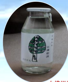
白樺樹液ドリンク

ヒメボタル観察と郷土料理(県産牛のミニステーキ付)、日本一の白樺美林から採れた白樺樹液100%ドリンクを楽しめるプレミアムな夜をお届けいたします。